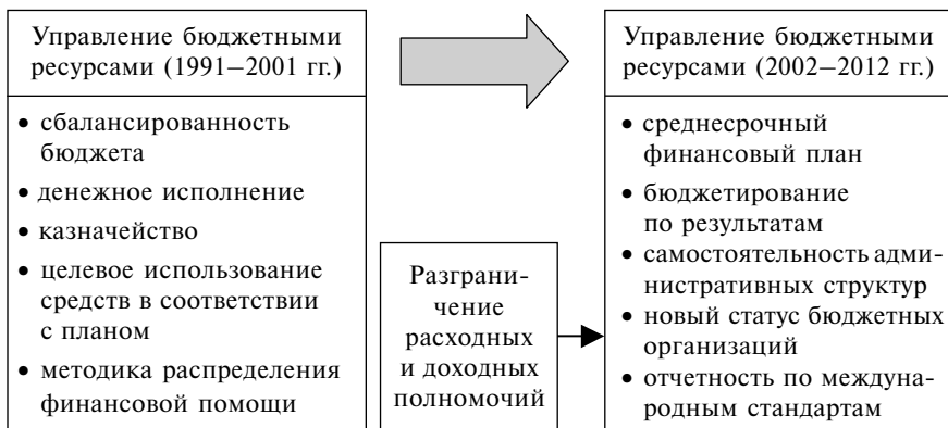
Схема 1. Подходы к развитию управления общественными финансами

ветствующих хозяйственных субъектов, перечень производимых в отрасли товаров и услуг и сопровождающие эти процессы финансовые потоки.