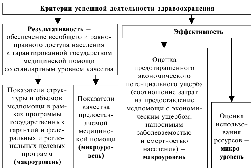
Схема 2. Критерии успешной деятельности здравоохранения

В настоящее время сохраняется низкая эффективность использования имеющегося очень важного ресурсного потенциала – первичного амбулаторно-поликлинического звена.